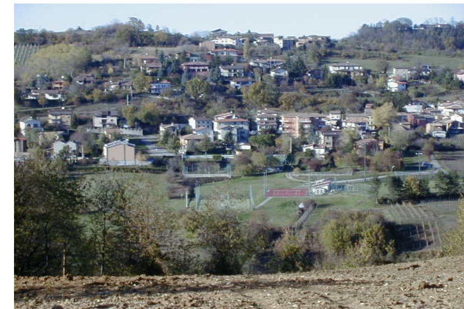
panorama del versante interessato dal corpo di frana quiescente

Lo stralcio della "Carta del dissesto idrogeologico" prodotta a fianco, in scala 1: 2.500, rappresenta una sintesi grafica delle risultanze del rilievo di campagna.