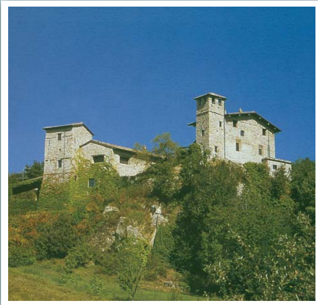
CASTELLO DEI ROSSI, già Rocca dei Gruppetti.