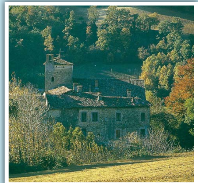
CASTELLO DI VEGGIOLA