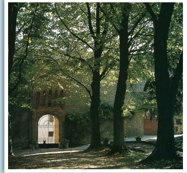
CASTELLO DI TAVASCA

I CASTELLI, LE CURIOSITÀ, IL TERRITORIO E L'OSPITALITÀ